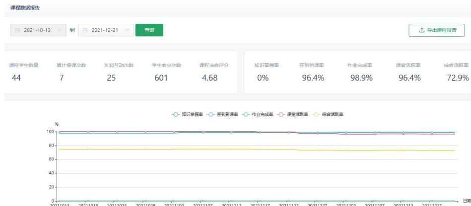
Fig. 2 Course data report for the most recent semester

智能机器人课程借助教学立方平台,统计课程混合式教学数据,内容包括课程学生数、授课数、课件阅读率、资源下载率、考勤签到、作业和教学评价等。最近一学期的智能机器人课程数据报告如图2所示,累计授课次数7次,教师发起互动25次,学生响应601次,考勤签到率96.4%,作业完成率98.9%,课程综合评分4.68(满分5分)。由于团队暂未在教学立方平台上建立课程知识内容关联,没有知识掌握统计数据,进而影响课程综合活跃度。